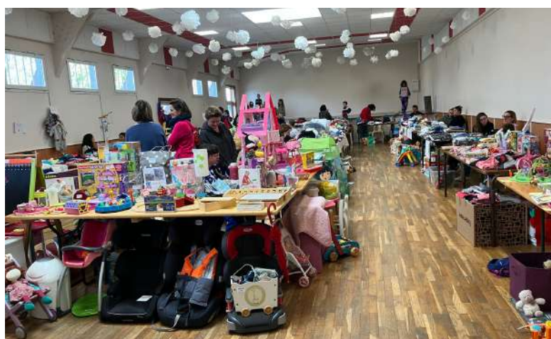
Bourse aux jouets et aux vêtements - Dimanche 19 Mars 2023 L'Association des parents d'élèves (AIPE) de l'école