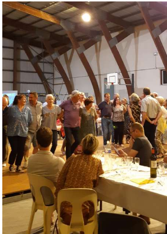
AG de Nature tu nous enchantes Septembre 2023