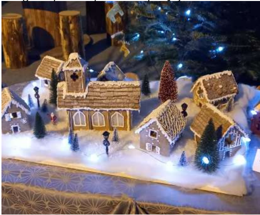
Village de pain d'épices crée par Juju

Samedi 16 décembre 2023 - en partenariat avec le Comité des fêtes