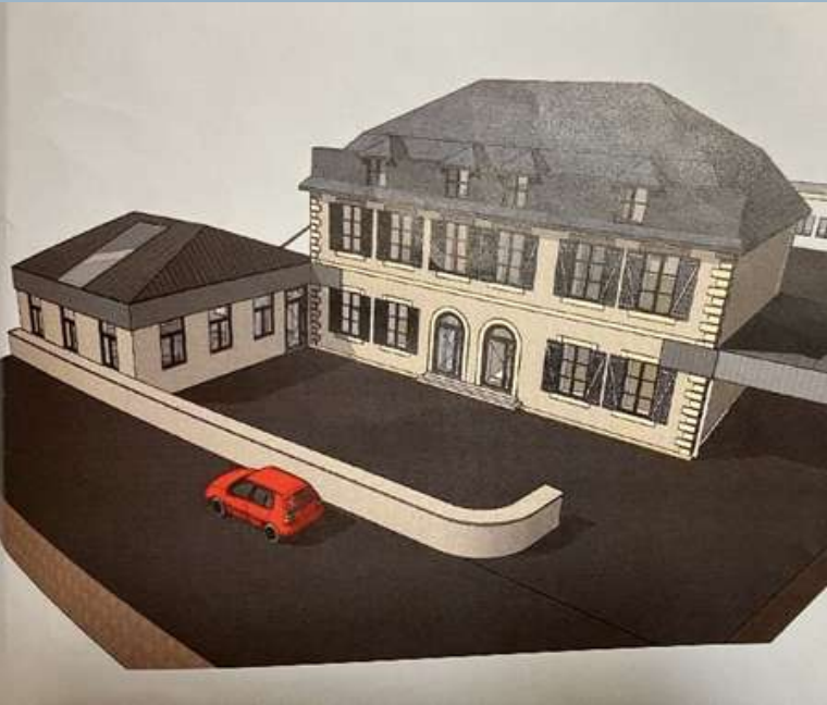
Projet d'extension de l'école