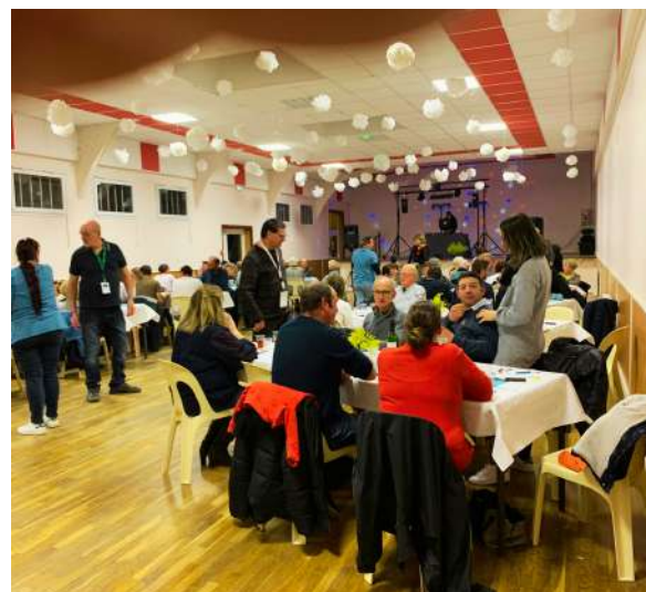
Repas Mique-Petit salé du Comité des fêtes Le samedi 4 mars 2023